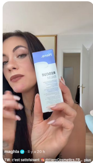
@JujuFitcats & @Maghla