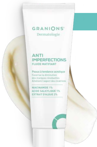
Anti-Imperfections Fluide matifiant GRANIONS® Dermatologie, tube de 40ml, 17€25