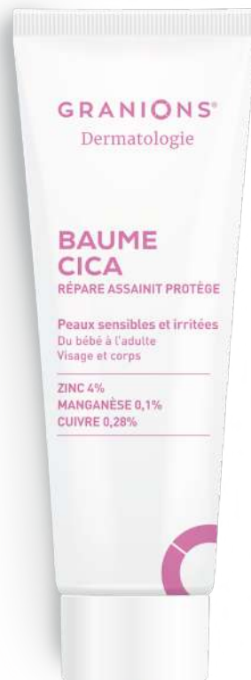
Baume Cica GRANIONS® Dermatologie tube de 40ml, 16€00

[LE+] ► Pour toute la famille, du bébé au plus âgé