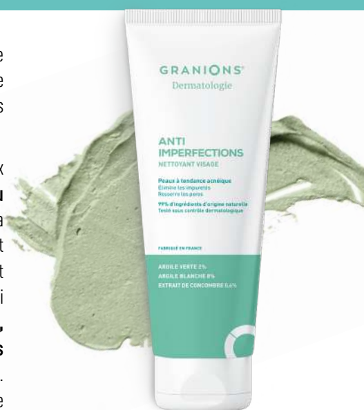
Anti-Imperfections Nettoyant Visage GRANIONS® Dermatologie tube de 150g, 18€30

[LE+] ► Produit 2 en 1 : Nettoyage quotidien & Masque 1 fois par semaine