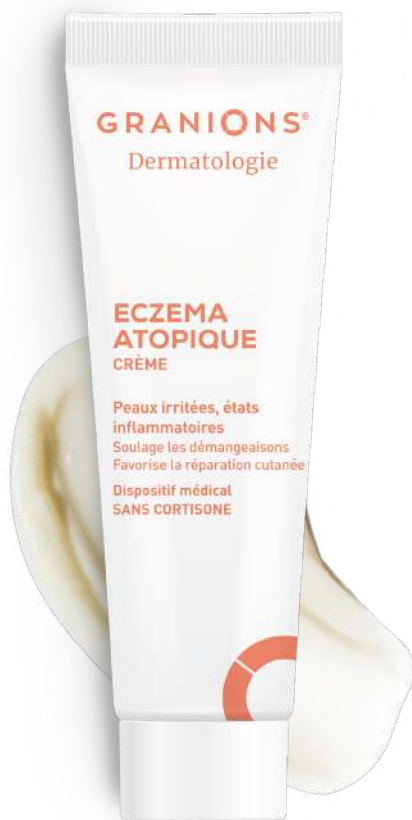
Eczéma atopique Crème GRANIONS® Dermatologie tube de 30ml, 14€80