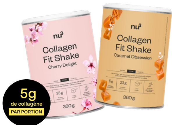
nu3 Collagen Fit Shake

Pour toutes celles qui veulent gagner du temps dans leur routine bien-être, nu3 a développé deux nouveaux en-cas nutritionnels au collagène, à la fois pratiques et gourmands. Les Collagen Beauty Bar qui apportent à l'organisme tout ce qu'il faut pour révéler l'éclat naturel de la peau, des cheveux et des ongles. Ainsi que les Collagen Fit Shake, une solution intelligente tout-en-un pour atteindre à la fois ses objectifs minceur, sport ET beauté !