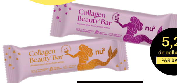
nu3 Collagen Beauty Bar

Au niveau européen, ce marché est estimé à 1,59Md$ en 2024 et devrait atteindre 2,15Md$ d'ici 2029.