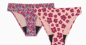
> CULOTTE MENSTRUELLE ADULTE MOTIF LIBERTY ET FLOWER DISPONIBLE EN FLUX MOYEN ET ABONDANT du XS au XXL - 35€ & 39€