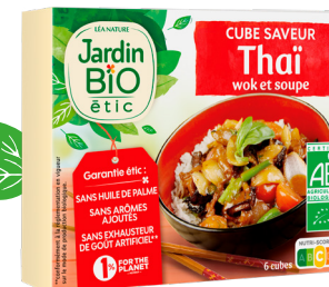
Bouillon de cube bio saveur thaï Jardin BiO étic® 6 cubes 11g, 2€09

Pratique et absolument succulent, ce bouillon cube volaille permet de rehausser en un tour de main le goût des soupes, risottos, céréales et plats cuisinés en tout genre puisqu'il suffit de le laisser se dissoudre dans un demi-litre d'eau bouillante pour obtenir un bouillon vraiment riche en saveurs. Si au menu on retrouve de la volaille évidemment, mais aussi des oignons, du céleri, des fines herbes et une pointe d'ail pour relever le tout, on se réjouit en revanche en constatant que, et contrairement à de nombreux bouillons proposés en GMS, ces cubes font l'impasse sur l'huile de palme, les exhausteurs de goût ou bien encore les arômes artificiels.