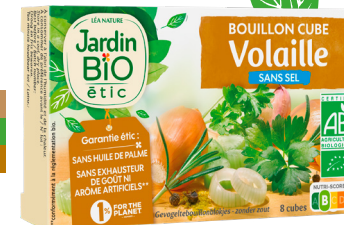
Bouillon cube volaille bio sans sel Jardin BiO étic® 8 cubes 9g, 2€45

Pratique et absolument succulent, ce bouillon cube volaille permet de rehausser en un tour de main le goût des soupes, risottos, céréales et plats cuisinés en tout genre puisqu'il suffit de le laisser se dissoudre dans un demi-litre d'eau bouillante pour obtenir un bouillon vraiment riche en saveurs. Si au menu on retrouve de la volaille évidemment, mais aussi des oignons, du céleri, des fines herbes et une pointe d'ail pour relever le tout, on se réjouit en revanche en constatant que, et contrairement à de nombreux bouillons proposés en GMS, ces cubes font l'impasse sur l'huile de palme, les exhausteurs de goût ou bien encore les arômes artificiels.