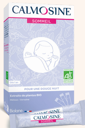
CALMOSINE SOMMEIL Pour une douce nuit Dès 1 an

En vente exclusivement en pharmacie www.calmosine.com