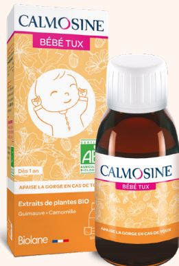
CALMOSINE BÉBÉ TUX Apaise la gorge en cas de toux Dès 1 an