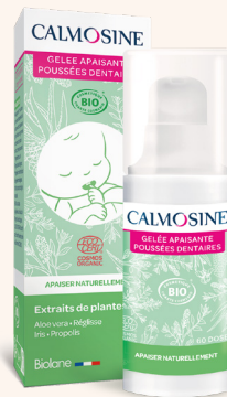
CALMOSINE GELÉE APAISANTE POUSSÉES DENTAIRES Pour apaiser naturellement Dès le plus jeune âge