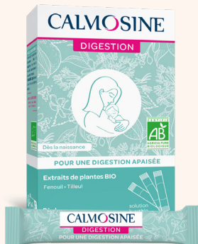
CALMOSINE DIGESTION Pour une digestion apaisée Dès la naissance