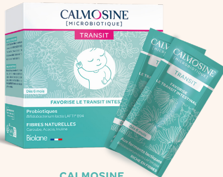
CALMOSINE MICROBIOTIQUE TRANSIT Favorise le transit intestinal Dès 6 mois