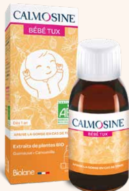
CALMOSINE BÉBÉ TUX Apaise la gorge en cas de toux Dès 1 an