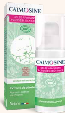
CALMOSINE GELÉE APAISANTE POUSSÉES DENTAIRES Pour apaiser naturellement Dès le plus jeune âge