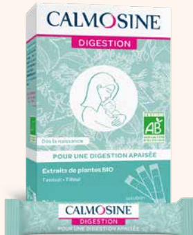
CALMOSINE DIGESTION Pour une digestion apaisée Dès la naissance