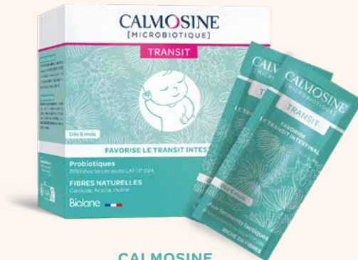
CALMOSINE MICROBIOTIQUE TRANSIT Favorise le transit intestinal Dès 6 mois