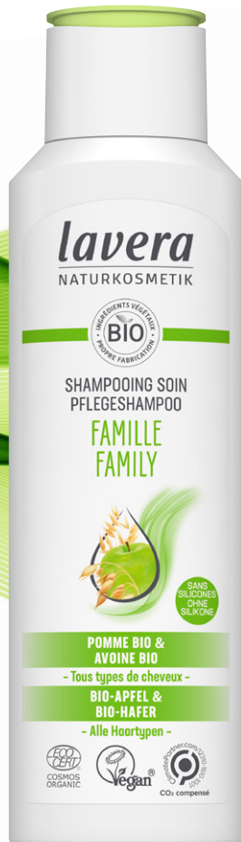
NOUVEAU Shampooing Soins Familie lavera Flacon 250ml, 8€