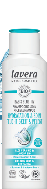
NOUVEAU Shampooing basis sensitiv, lavera Flacon 250ml, 8€

vie quotidienne et plus particulièrement dans notre salle de bains. Là encore, la marque allemande a une réponse à apporter et même deux en l'occurrence. Tout d'abord, on salue son pratique système de recharge permettant de refiller 2 fois son tube (ce dernier étant composé à 100% composé de plastique recyclé, il est toujours bon de le rappeler ). Une gestuelle vertueuse, permettant d'économiser 75% de plastique par rapport à l'achat d'emballages traditionnels, que lavera proposait déjà pour ses savons pour les mains et qu'on adoptera donc désormais aussi pour ce shampooing basis sensitiv. Et pour celles et ceux qui ont basculé du côté « cosmétique solide » de la force, saluons surtout ce tout nouveau shampooing basis sensitiv proposé en pain. Avec son pH neutre, il referme les écailles du cheveu pour leur apporter douceur et brillance, ce qui constitue pour lui une pure formalité lorsqu'on sait qu'il intègre lui aussi à sa recette vertueuse l'Aloe Vera bio et le Jojoba bio.