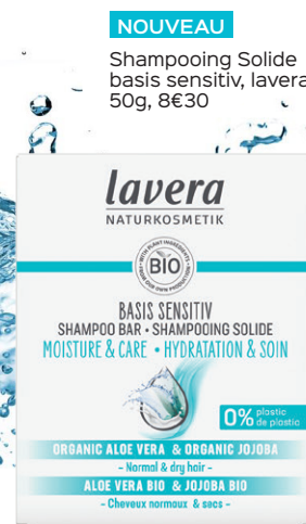
NOUVEAU Shampooing Solide basis sensitiv, lavera 50g, 8€30