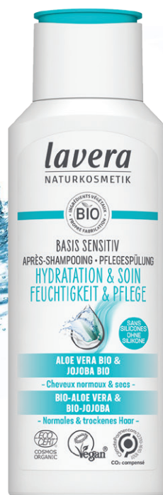
NOUVEAU Après-Shampooing basis sensitiv, lavera Flacon 200ml, 8€20