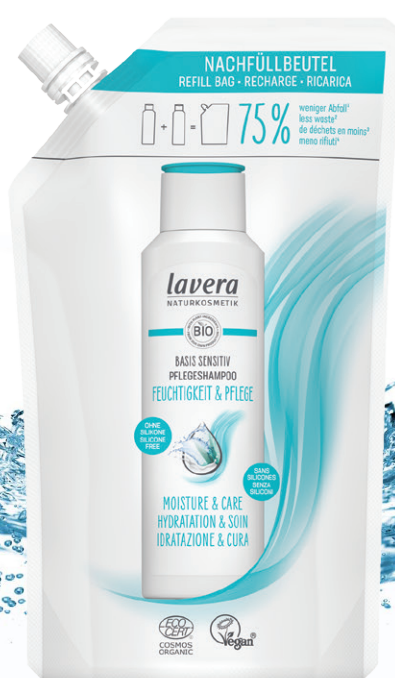
NOUVEAU Recharge Shampooing basis sensitiv, lavera Doypack 250ml, 10€60