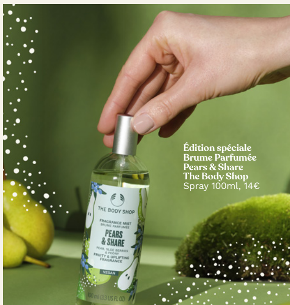
Édition spéciale Brume Parfumée Pears & Share The Body Shop Spray 100ml, 14€