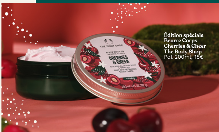
Édition spéciale Beurre Corps Cherries & Cheer The Body Shop Pot 200ml, 18€