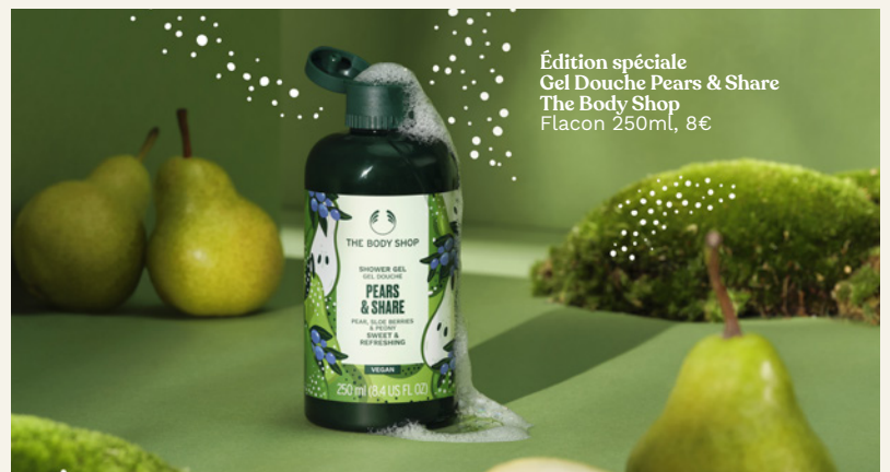
Édition spéciale Gel Douche Pears & Share The Body Shop Flacon 250ml, 8€

Dans la vie, on a paraît-il parfois tendance à être « une bonne poire », notre gentillesse nous perdra, on le sait ! Mais que voulez-vous, on aime contribuer à un monde meilleur, comme lorsqu'on opte pour ce gel douche moussant dont la formule s'appuie notamment sur l'Aloe Vera certifié Commerce Équitable du Mexique, une des nombreuses filières vertueuses mises en place par The Body Shop et permettant à des agriculteurs engagés de vivre dignement de leur travail. Bon, on l'avoue, on le fait aussi de manière un peu plus égoïste, et simplement parce qu'on est littéralement tombé sous le charme de ce gel douche, tant pour sa formule contenant 92% d'ingrédients d'origine naturelle que pour son délicieux parfum associant les notes de poire, de pivoine et de prune, sans oublier non plus son emballage 100% recyclable.