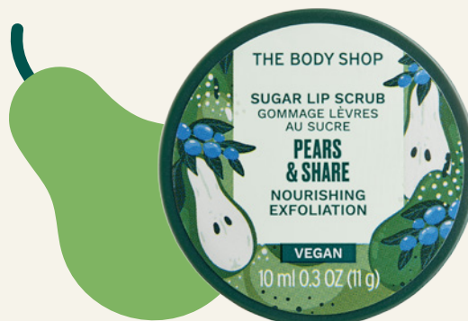
Édition spéciale Gommage Lèvres Pears & Share The Body Shop Pot 10ml, 6€