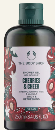
Édition spéciale Gel Douche Cherries & Cheer The Body Shop Flacon 250ml, 8€

« Tout tout pour ma chérie » disait une célèbre chanson des 70's ? On reprend le refrain à notre tour en entonnant sous la douche « tout tout pour ma cherry », notre déclaration à ce gel douche à l'enivrant parfum de cerise, de feuilles de figuier, de lait d'amande et de vanille. Du bonheur à l'état pur, et du réconfort aussi pour la peau qui se réjouit de retrouver dans sa formule 92% d'ingrédients d'origine naturelle, parmi lesquels l'extrait de Cerise et l'Aloe Vera certifié Commerce Équitable du Mexique. Ajoutez à cela une bouteille 100% recyclée et nous sommes proche de la perfection.