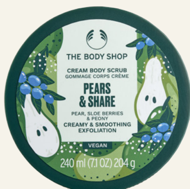
Édition spéciale Exfoliant Corps Pears & Share The Body Shop Pot 240ml, 18€

Les gommages The Body Shop, c'est peu de dire qu'on les aime d'amour et celui-ci ne fera pas exception à la règle. On adore tout chez lui, à commencer par sa texture crémeuse qui assure une exfoliation efficace mais tout en douceur grâce à sa formule contenant pas moins de 96% d'ingrédients d'origine naturelle, parmi lesquels le beurre de Karité du Ghana et l'huile de Noix du Brésil, venue du Pérou (tous deux certifiés Commerce Équitable) ou bien encore l'extrait de Poire d'Italie. Un bon point bien entendu pour son envoûtant parfum associant les notes de poire, de prune et de pivoine, ainsi que pour son emballage 100% recyclable et comprenant 50% de plastique recyclé.