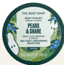
Édition spéciale Yaourt Corps Pears & Share The Body Shop Pot 200ml, 12€