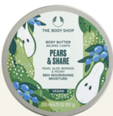
Édition spéciale Beurre Corps Pears & Share The Body Shop Pot 200ml, 18€

Si l'on est plutôt en quête d'un soin en gel, on mise alors sur ce yaourt corps qui hydrate instantanément et durant 48h. Lui aussi se distingue par une haute concentration en ingrédients d'origine naturelle (89%) parmi lesquels on peut par exemple citer le lait d'Amande biologique et le beurre de Karité du Ghana (deux ingrédients certifiés en prime Commerce Équitable) et l'incoutournable extrait de Poire d'Italie. Les pots de ces deux hydratants corporels ? C'est vrai, ils sont magnifiques avec leurs patterns mais surtout, il s'agit d'emballages 100% recyclables comprenant au moins 50% de plastique recyclé.