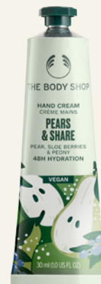
Édition spéciale Crème Mains Pears & Share The Body Shop Tube 30ml, 7€

Beurre de Karité du Ghana, huile d'Amande douce bio d'Espagne, huile de Babassu bio du Brésil... cette crème mains s'appuie - en plus bien entendu de l'extrait de Poire d'Italie - sur des ingrédients certifiés Commerce équitable chers au cœur de la marque créée par Anita Roddick. Tout ce qu'il faut en somme pour s'assurer de 48 heures d'hydratation, mais surtout de mains délicatement parfumées, un vrai bonheur. The Body Shop oblige, son tube et son bouchon sont composés d'aluminium 100% recyclables.