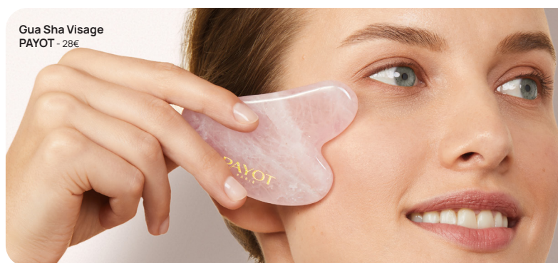
Gua Sha Visage PAYOT - 28€

Ce roller, tout premier outil de massage créé par PAYOT, est doté de deux têtes sphériques massantes en Zinc (3) qui favorisent la pénétration des soins et la décongestion des tissus. En roulant sur l'épiderme, elles reproduisent mécaniquement l'action des pincements Jacquet. Pour rappel, cette technique manuelle, reconnue dans le domaine du modelage visage, contribue à raffermir les tissus et augmenter l'élasticité de la peau en stimulant des points clés du visage, du cou et du décolleté.