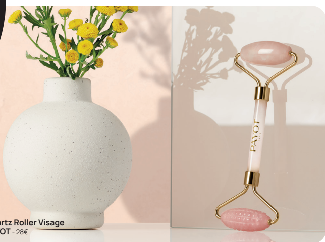
Quartz Roller Visage PAYOT - 28€

Issu de la médecine traditionnelle chinoise, le Gua Sha pour le visage permet une gestuelle liftante et sculptante anti-âge. Sa forme en cœur a été étudiée pour épouser parfaitement les contours du visage et permettre une gestuelle plus ciblée au niveau du contour de l'oeil grâce à son embout plus fin. Il est composé de quartz rose, reconnu en lithothérapie pour ses vertus apaisantes.