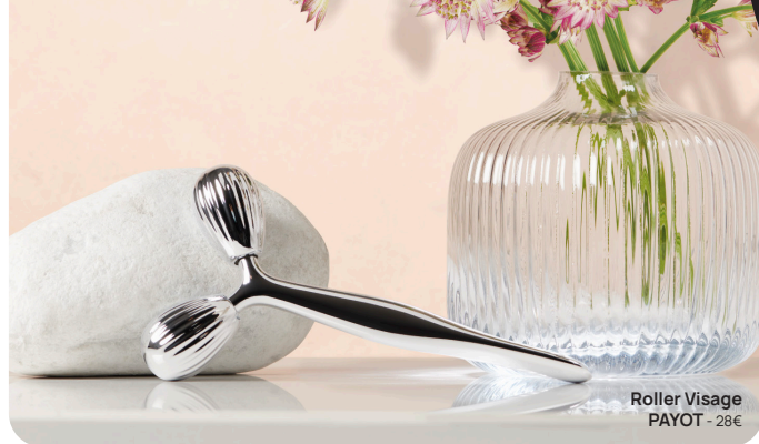
Roller Visage PAYOT - 28€

Pour cette dernière portant haut les couleurs de la cosmétique française, le geste qui fait partie de son ADN, est en effet indispensable pour venir potentialiser l'action des soins cosmétiques. Et c'est justement pour cela qu'elle a développé des formules clean (1) d'inspiration néo-apothicaire pensées pour être utilisées avec les GYM BEAUTÉ PAYOT® qui en renforce davantage l'efficacité. Cet automassage ciblé du visage se réalise en une minute top chrono et peut se pratiquer simplement à l'aide de ses doigts et paumes, un exercice rapide à faire et qui participe au passage d'une beauté holistique, l'occasion de se reconnecter à soi-même le temps d'un instant de détente. Une fois ce réflexe salvateur adopté, on a rapidement envie d'aller plus loin et c'est précisément là qu'interviennent ces 4 Face Moving (2) pensés pour stimuler, drainer, décongestionner et détendre les muscles faciaux.