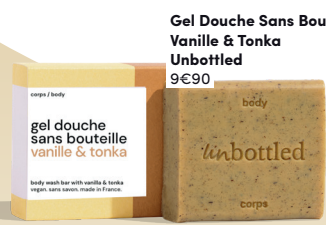
Gel Douche Sans Bouteille Vanille & Tonka Unbottled 9€90