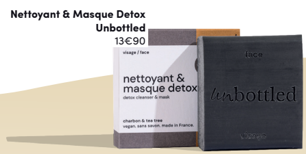
Nettoyant & Masque Detox Unbottled 13€90

Pour une toilette résolument cocooning cet hiver, quel meilleur complice que ce nouveau parfum de l'incoronable Gel Douche Sans Bouteille Unbottled. Avec ses notes gourmandes de vanille et tonka, ses ingrédients enveloppants tels que l'huile d'Amande douce et le beurre de Cacao, il est la promesse d'une parenthèse de douceur.