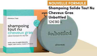
NOUVELLE FORMULE Shampooing Solide Tout Nu Cheveux Gras Unbottled 12€90

Pour celles et ceux dont le visage et les cheveux sont de mèche niveau surproduction de sébum, Unbottled propose ce 2-en-1 détox, à la fois nettoyant-masque, qui contient du Zinc anti-bactérien. Son action est complétée par le Charbon et le Tea tree pour laisser la peau saine, nette et fraîche.