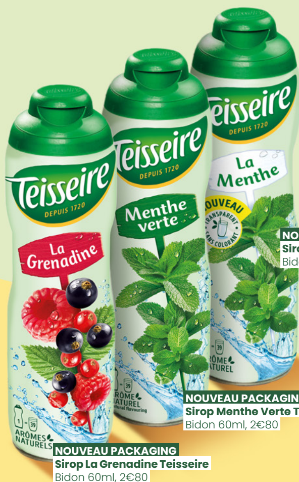
NOUVEAU Sirop La Menthe Teisseire Bidon 60ml, 2€80

La finalité du travail entrepris depuis plusieurs années par la marque iséroise et qui lui permet aujourd'hui de proposer des recettes toujours plus authentiques (c'est ainsi que son inimitable Menthe est aussi devenue transparente, laissant à chacun le choix entre les deux) et désormais sans arômes artificiels. Pourquoi donc composer avec eux lorsqu'on a la chance de pouvoir s'appuyer sur le bon goût de fruits résolument gourmands ? Une manière de répondre toujours au plus proche aux attentes des consommateurs (et notamment des familles) qui exigent des produits plaisants certes, mais surtout rassurants. C'est d'ailleurs pour répondre à leur appétence pour des boissons moins sucrées que Teisseire, moteur de l'innovation et prescripteur de tendances, enrichit cette année sa gamme Zéro, rencontrant un succès sans cesse grandissant.