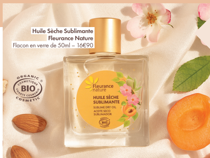
Huile Sèche Sublimante Fleurance Nature Flacon en verre de 50ml – 16€90