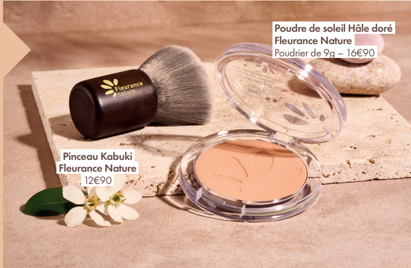
Poudre de soleil Hâle doré Fleurance Nature Poudrier de 9g – 16€90

La Poudre de soleil Hâle doré, enrichie en huile d'argan bio et équitable, donne instantanément un effet bonne mine grâce à ses pigments minéraux naturels. Sa texture fine et aérienne à base d'amidon de maïs offre un toucher doux et soyeux sur la peau. Pour une application optimale, le pinceau Kabuki permet d'appliquer la poudre sur le front, le nez, le contour du visage, les pommettes et le décolleté pour intensifier le hâle naturel toute l'année et sublimer le bronzage en été. L'effet glowy est garanti !