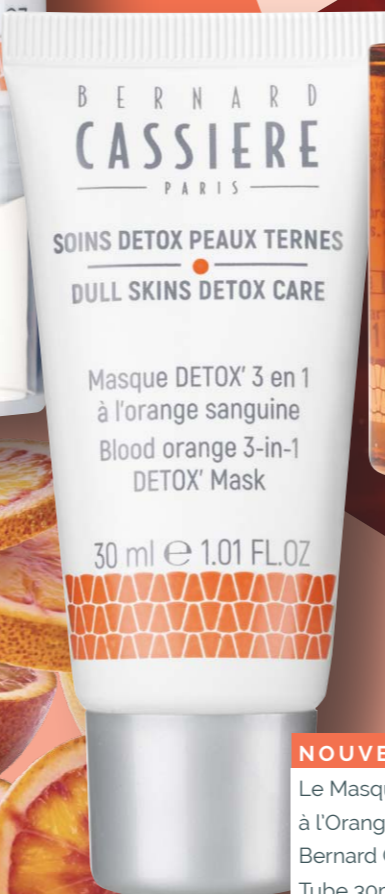
NOUVEAU Le Masque DETOX 3 en 1 à l'Orange Sanguine Bernard Cassière Tube 30ml, 19€