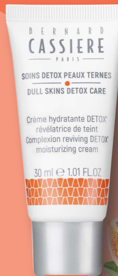
NOUVEAU Crème Hydratante DETOX Révélatrice de Teint Bernard Cassière Tube 30ml, 25€

Peut-être vous souvenez-vous du film d'horreur (culte pour toute une génération) The Ring ? Son pitch était on ne peut plus simple : chaque personne qui visionnait une cassette vidéo maudite disparaissait 7 jours plus tard. Pourquoi vous parler de ça ? Parce que c'est un peu ce qui arrive au teint gris et fatigué lorsqu'il voit débarquer dans la salle de bains ce nouveau sérum éclat qui délivre lui aussi sa magie en 7 jours top chrono. Un vrai coup de fouet pour une peau détournée, comme ré-énergisée, qu'on peut utiliser en cure à chaque changement de saison par exemple. Sa formule s'appuie bien entendu sur le complexe DETOX nouvelle génération (extrait d'Orange Sanguine + extrait d'agrumes upcyclés + extrait de Baies 5 Saveurs) mais intègre aussi un dérivé de Vitamine C pour potentialiser un peu plus encore son pouvoir illuminateur. Sans surprise, le teint est plus uniforme, plus frais et plus lumineux. Parfaitement hydraté aussi, grâce notamment à l'Acide Hyaluronique de haut poids moléculaire qui vient parfaire cette formule, vegan , et composée à plus de 96% d'ingrédients d'origine naturelle.