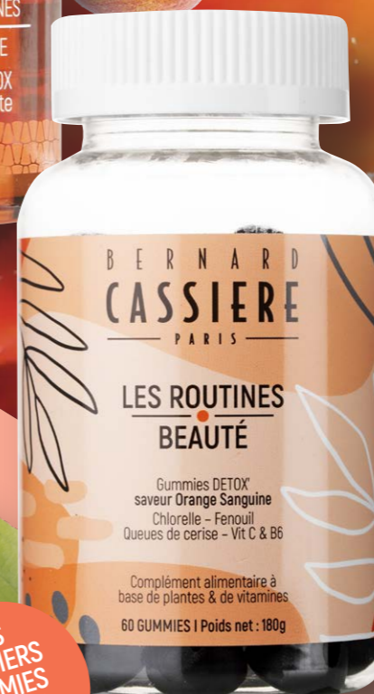
NOUVEAU Gummies DETOX Bernard Cassière Boîte de 60 gummies, 21€90