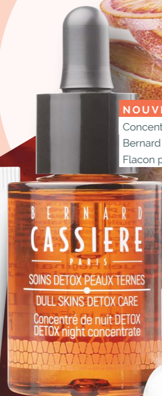
NOUVEAU Concentré de Nuit DETOX Bernard Cassière Flacon pipette 30ml, 31€90