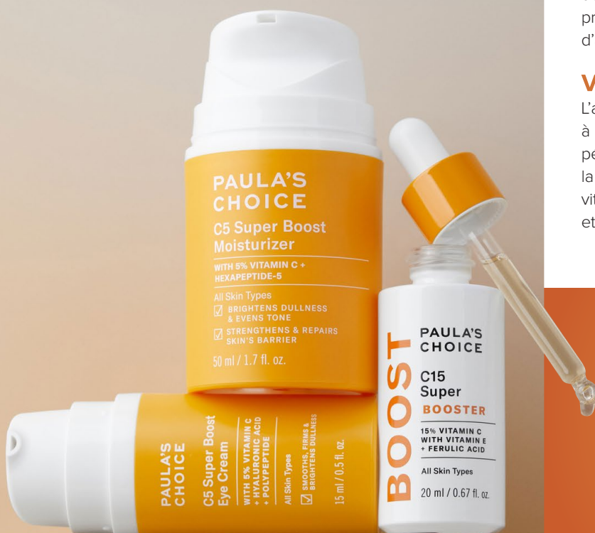
C15 Super Booster