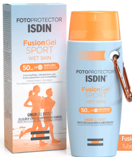
Fusion Gel Sport ISDIN Tube 100ml, 22€35

Avant de démarrer l'activité physique de notre choix, on applique ce gel dont l'effet frais immédiat aidera à réguler la température du corps pendant l'exercice. Sa formule est en prime enrichie en GINGEL CELL PROTECT, un extrait de racine de Gingembre 100% naturel qui fortifie les cellules contre les dommages induits par les UVB et assure une activité antioxydante pour combattre les dommages oxydatifs. Toutes les deux heures, lors par exemple d'une activité physique longue comme la randonnée ou un marathon, on procède à une nouvelle utilisation et cela d'autant plus facilement que son format nomade et clipsable - à un short, un sac à dos - permet de pouvoir compter sur lui en n'importe quelles circonstances. En somme, c'est un indispensable de l'été (mais pas que car n'oublions pas que 90% de la radiation UV traverse les nuages, il convient donc idéalement de se prémunir du soleil durant toute l'année) dont on apprécie au passage la formule Sea Friendly puisque la majorité de ses ingrédients sont inorganiques et/ou biodégradables.