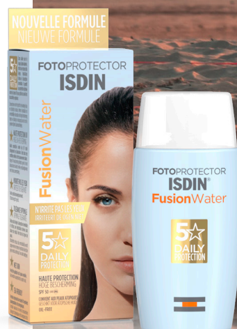
Fusion Water SPF50 ISDIN Flacon 50ml, 27€05

On appréciait déjà tout particulièrement cette crème solaire dans notre vie quotidienne et cela pour bien des raisons, à commencer par la parfaite protection SPF50 qu'elle assure, mais aussi pour sa texture oil-free d'une époustouflante légèreté. Ajoutez à cela son absorption immédiate et sans la moindre trace et nous étions déjà alors tout proche du « perfect ». Mais voilà qu'on découvre qu'elle a un autre atout à faire valoir, un argument qui fera mouche auprès des sportifs car il s'agit en effet d'un des rares produits solaires à ne pas piquer les yeux. Un point appréciable d'une manière générale mais encore plus lorsqu'on pratique un sport puisque la transpiration, notamment au niveau du front, a cette fâcheuse tendance lors d'un effort intensif à glisser au niveau de la zone oculaire, pouvant alors provoquer de désagréables sensations de picotements altérant en prime la concentration.