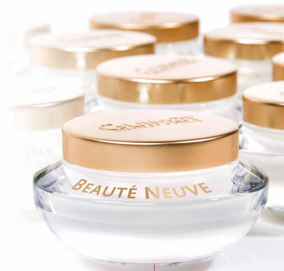
Crème Beauté Neuve GUINOT Pot 50ml, 74€ (3)

Riches en acides gras saturés, le Liposkin et le Complexe de Cires Végétales participent à rétablir la barrière cutanée et aident à nourrir intensément l'épiderme. Mieux protégée, la peau retrouve rapidement tout son confort et sa souplesse.