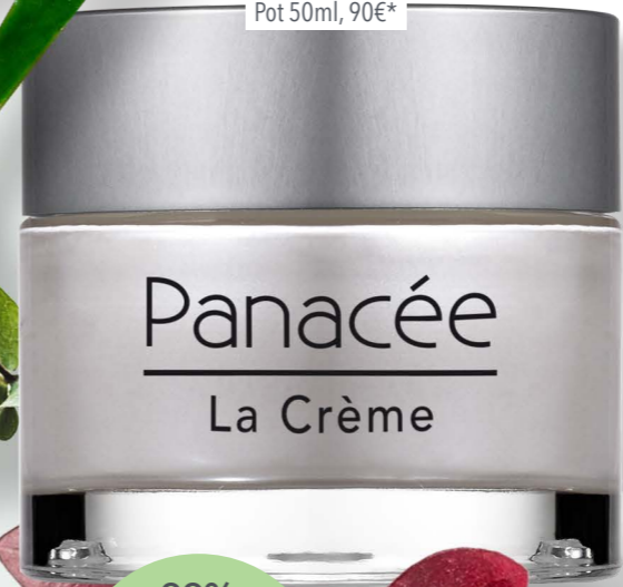
Panacée La Crème Anti-âge Globale PHYT'S Pot 50ml, 90€*

100% DES INGRÉDIENTS SONT D'ORIGINE NATURELLE 15% DES INGRÉDIENTS SONT ISSUS DE L'AGRICULTURE BIOLOGIQUE