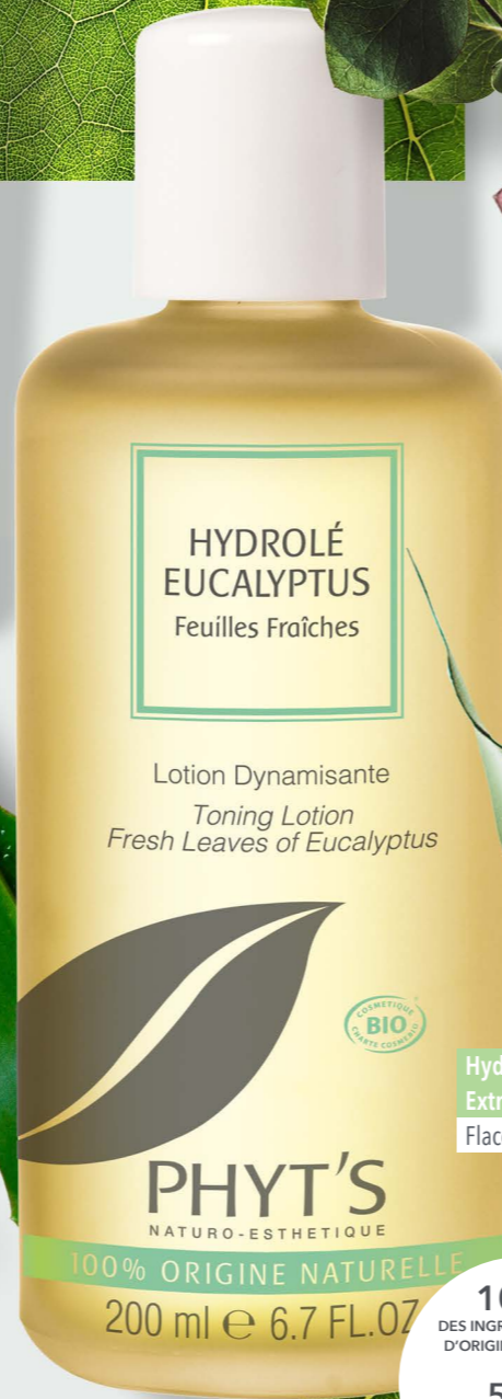
Hydrolé Eucalyptus Extrait de Plantes Fraîches PHYT'S Flacon 200ml, 19€*

99% DES INGRÉDIENTS SONT D'ORIGINE NATURELLE 49% DES INGRÉDIENTS SONT ISSUS DE L'AGRICULTURE BIOLOGIQUE