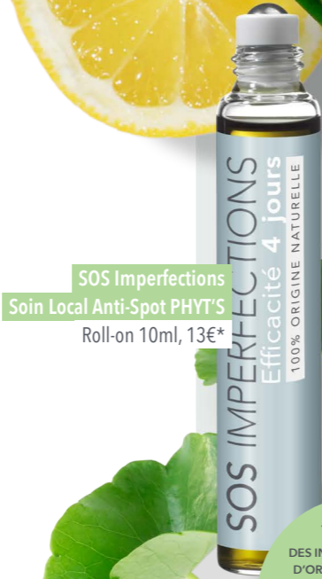
SOS Imperfections Soin Local Anti-Spot PHYT'S Roll-on 10ml, 13€*

100% DES INGRÉDIENTS SONT D'ORIGINE NATURELLE 56% DES INGRÉDIENTS SONT ISSUS DE L'AGRICULTURE BIOLOGIQUE