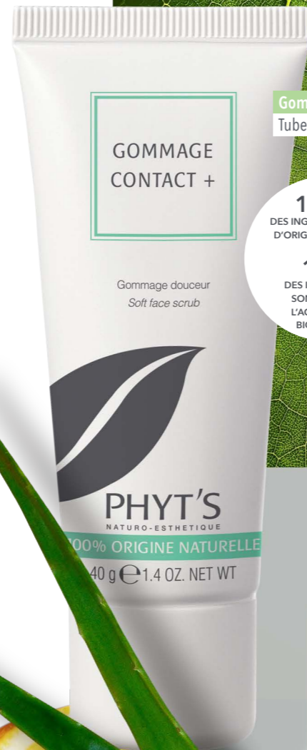
Gommage Contact+ PHYT'S Tube 40g, 27€50*

S'il y a des « cris et des S.O.S » qui ont bien été entendus par PHYT'S, ce sont bien ceux des peaux à problèmes et sujettes aux petites (mais non moins très pénibles) imperfections. Avec ce soin local intensif asséchant, la marque experte de la cosmétique certifiée bio leur offre une solution express pour venir à bout des petits boutons en quelques jours à peine. Véritable synergie d'huiles essentielles de Géranium bio et d'Origan bio purifiantes associées à celle de Citron éclaircissant, il recèle également des extraits végétaux de Centella Asiatica bio, puissant régénérant cutané et de Mauve apaisante. Un cocktail naturel, dont 99% des ingrédients sont issus de l'Agriculture Biologique, qui apaise l'inflammation et facilite la résorption des imperfections, tout en limitant l'apparition de traces résiduelles et rougeurs, pour une peau plus nette et plus saine. Mention spéciale pour le format roll-on qui permet une application hygiénique et ciblée quel que soit l'endroit où on se trouve.