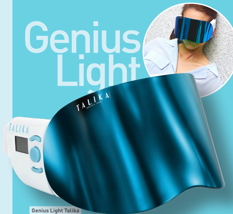
Genius Light Talika 329€