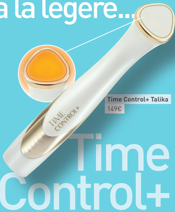
Time Control+ Talika 149€