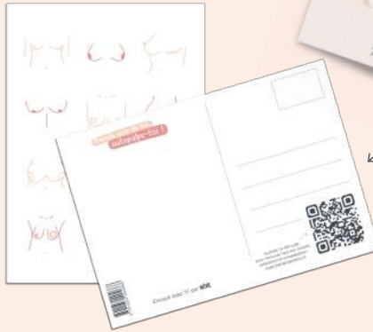
1 carte postale pour sensibiliser une proche à l'autopalpation

1 calendrier à encadrer Chaque mois, repasser au feutre l'illustration pour ne plus jamais oublier de s'autopalper