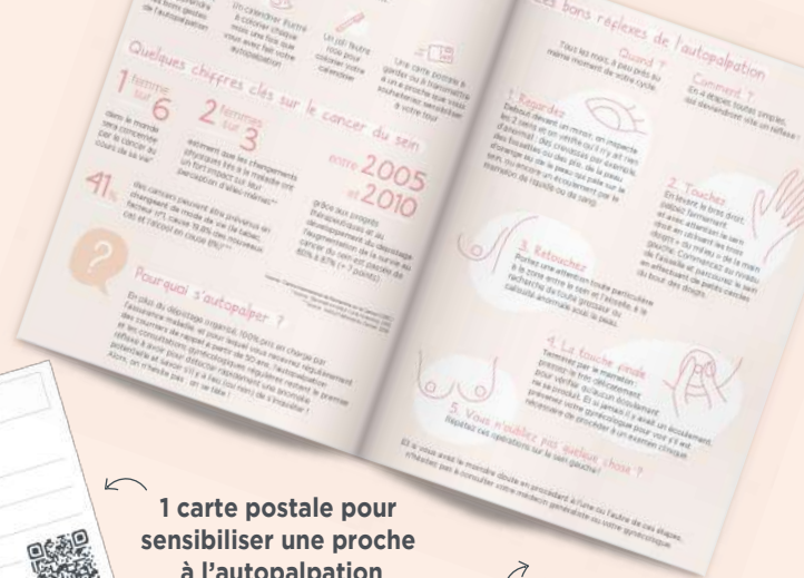
1 guide de sensibilisation à l'autopalpation