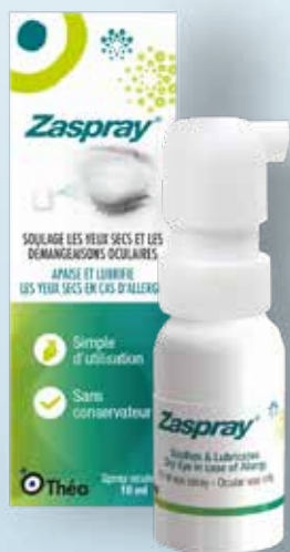
ZASPRAY® LABORATOIRES THÉA Dispositif médical classe IIb Spray 10 ml : 14€40* Code EAN : 8034135273109

Son + : son format spray qui s'applique sur les paupières, les yeux fermés. Idéal pour les personnes qui ont des difficultés à utiliser des gouttes oculaires. Zaspray® peut être utilisé en association avec des traitements anti-allergiques habituels.