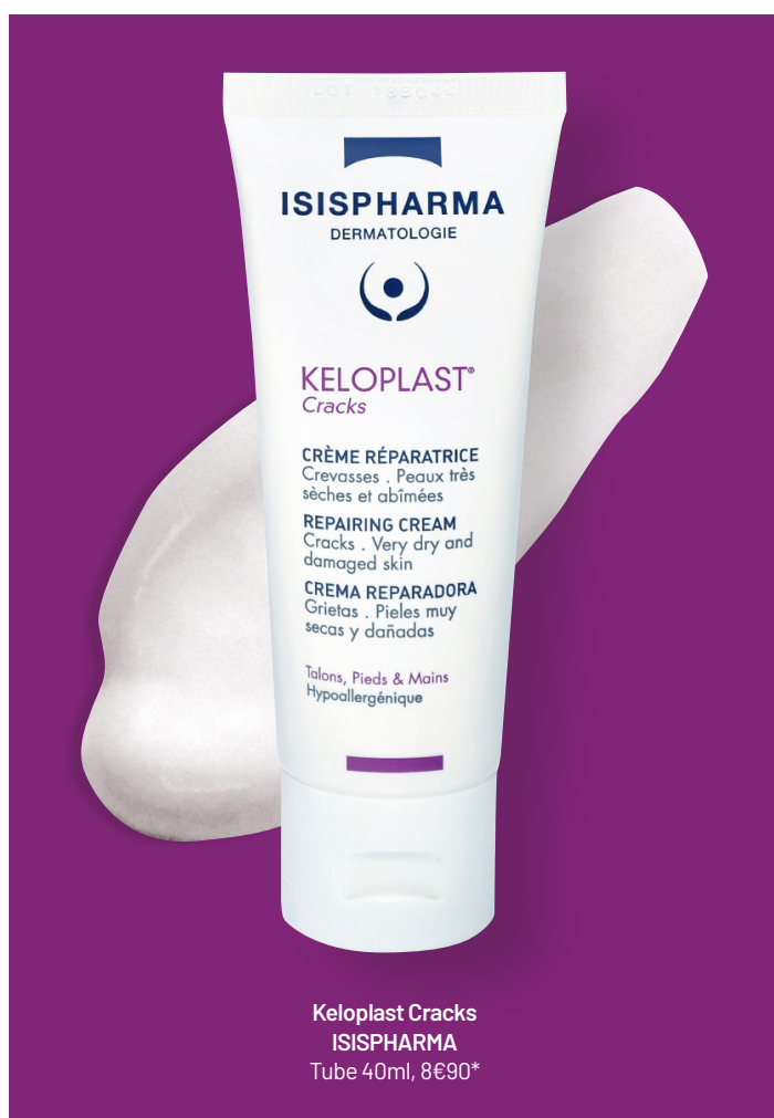
Keloplast Cracks ISISPHARMA Tube 40ml, 8€90*

CHARGÉE DE PROJET SCIENTIFIQUE CHEZ ISISPHARMA