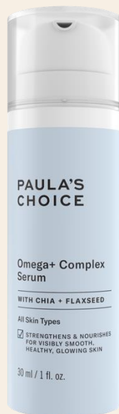
Omega+ Complex Sérum