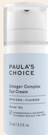
Omega+ Complex Crème Contour Yeux