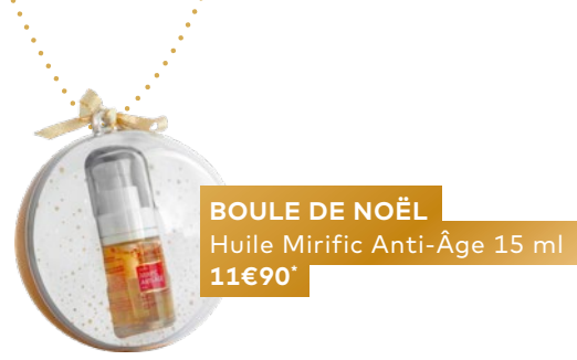
BOULE DE NOËL Huile Mirific Anti-Âge 15 ml 11€90*

GUINOT propose cette année des coffrets exceptionnels réunissant ses favoris, pour faire plaisir à toutes les femmes de son entourage et pour tous les budgets . Le Coffret Premium contenant la Crème Age Summum et son accessoire d'application doré fera son effet "wahou" à coup sûr. Le best-seller de la marque, la Crème Longue Vie de GUINOT, n'est pas oublié non plus avec un coffret spécial réunissant la crème et son sérum. Les plus impatientes pourront de leur côté (se) faire plaisir avec le nouveau Calendrier de l'Avent qui réunit 24 produits GUINOT et MASTERS COLORS, pour une surprise sublimatrice chaque jour jusqu'à Noël !