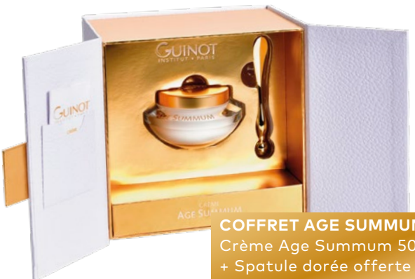
COFFRET AGE SUMMUM Crème Age Summum 50 ml + Spatule dorée offerte 218€*