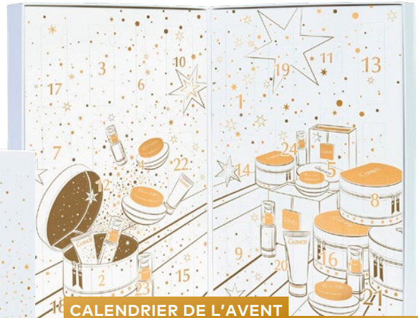
CALENDRIER DE L'AVENT 24 produits GUINOT et MASTERS COLORS 89€*