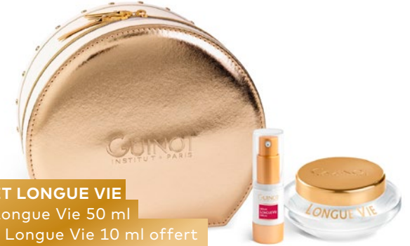
COFFRET LONGUE VIE Crème Longue Vie 50 ml + Sérum Longue Vie 10 ml offert 98€*