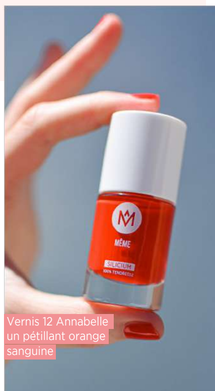
Vernis 12 Annabelle un pétillant orange sanguine