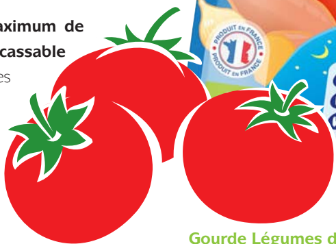
Gourde Légumes doux Tomate Millet, 120g : 0.90€