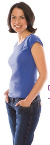
Caroline -7 kg

Udani J, et al. Blocking carbohydrate absorption and weight loss: a clinical trial using a proprietary